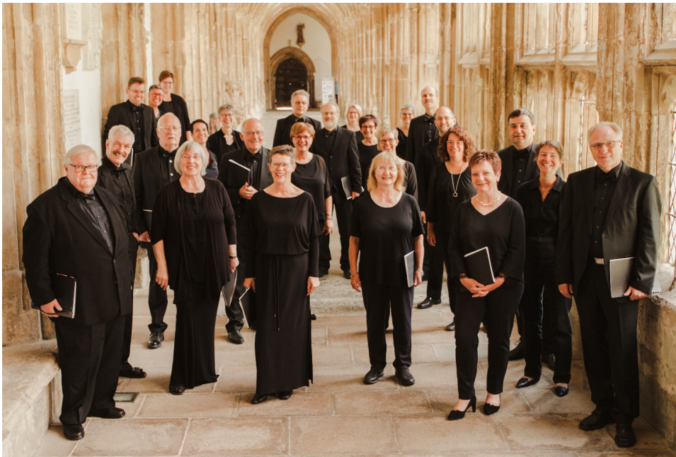
Chorfoto (@Stefan Ulrich)

Der Evensong ist eine besondere liturgische Form der anglikanischen Kirche, die sich als gesungenes Abendlob in den letzten Jahren zunehmender Beliebtheit auch in Deutschland erfreut. Das liegt besonders an seiner offenen Form, in der neben feststehenden Lesungen, Gebeten und Hymnen viel Musik erklingen kann. Hierbei spielt die besondere Atmosphäre eine wichtige Rolle. Sie wird von meditativen, ruhigen und kontemplativen Elementen der Texte und Musik getragen und will einen willkommenen Kontrast zu unserer schnelllebigen, lauten und unruhigen Zeit sein.