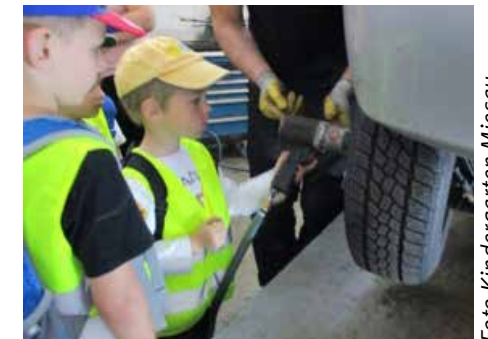
Foto Kindergarten Miesau