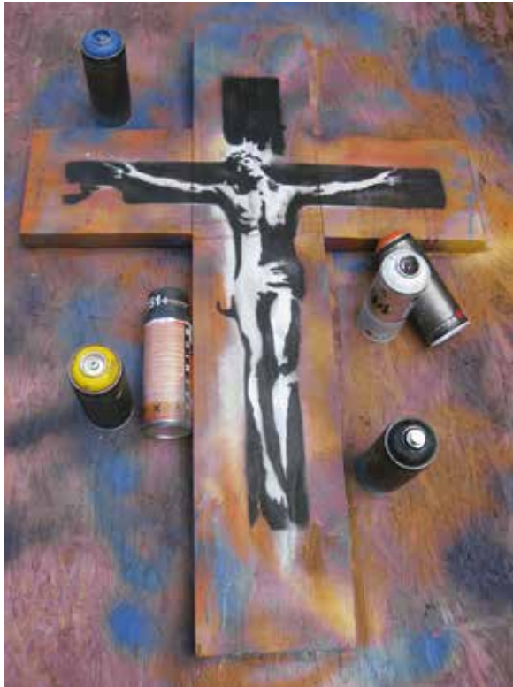
Motiv des Kreuzwegs der Jugend 2017

Bei der Kunstform Stencil Art werden zunächst Schablonen mit Motiven aus Pappe oder beispielsweise Kunststoff geschnitten. Diese werden mit Farbsprühdosen oder Ölkreide aufgebracht. Damit ist jedes Bild wiederholbar und trotzdem völlig einzigartig. Diese Straßenkunst, die für Botschaften und gegen Missstände eine Öffentlichkeit schafft, greift der Jugendkreuzweg auf.