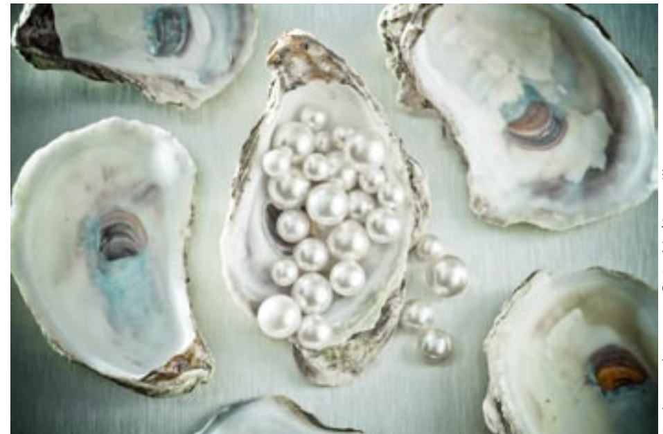
Perlen und Austern

2 – Versweise • 3 – Jubelkonfirmationen/ Neuer Kurs zur Konfirmation • 4-5 – Termine Gries & Miesau • 6 – KiGo Miesau/ KiGa Miesau • 7 – Rito Pedersen/ Männerdämmerchoppen/ Konfirmandendankspende • 8 – KiTa Gries