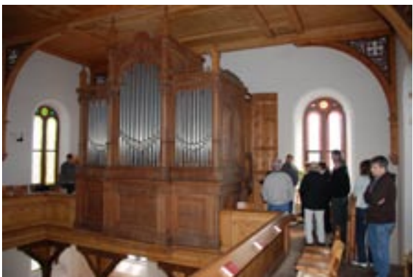
Stumm-Orgel St. Julian