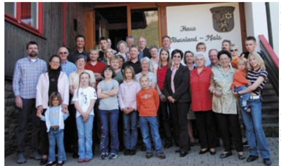
Gruppenbild vor dem Haupteingang