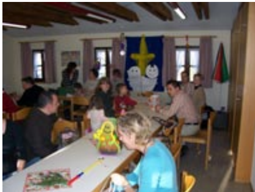
Viel Spaß beim Essen und Basteln!

Herzlichen Dank an alle Frauen, die unsere Brunchtafel mit so vielen Köstlichkeiten schmückten. Unser nächster Familientag wird im Frühjahr stattfinden.