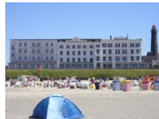
CVJM-Haus Viktoria, Borkum